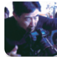
高嶋 清俊 (写真家)