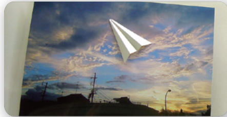
■ ミュージアムショップでの販売

伊丹ジュエリーカレッジでジュエリー制作を学んで1年。その成果を発表する受講生にとって初めての作品展です。作品制作から展示を一貫して学び、来場者への対応までを体験します。