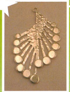
昨年度 受講生作品

1970 多摩美術大学美術学部彫刻科卒業 行動美術展新人賞 1975より 日本ジュウリーアート展・国際ジュウリーアート展に出品 1989 オーストリア「日本装飾品芸術展」 1999・2001 オーストリア「Japanese Jewelry Exhibition」 2002 台湾・日本・韓国・三国女性メタルアーチスト創作巡回展 個展：神戸・大阪・京都・東京 グループ展多数 現在：アトリエ コミヤ代表・日本ジュウリーデザイナー協会理事