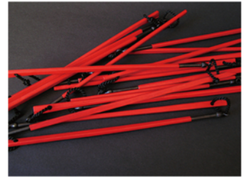
「割箸ジュエリー」 2005年

2007, 2011年 伊丹国際クラフト展「ジュエリー」入選 2012年 2012日本ジュエリーアート展 奨励賞