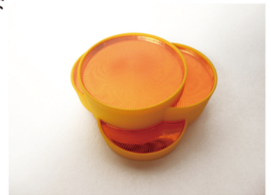
ブローチ「スペインの太陽」 2013年