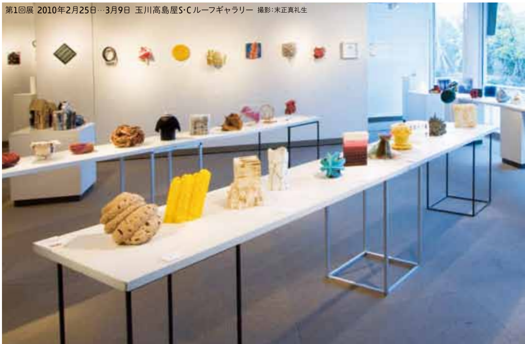
第1回展 2010年2月25日…3月9日 玉川高島屋S・Cルーフギャラリー